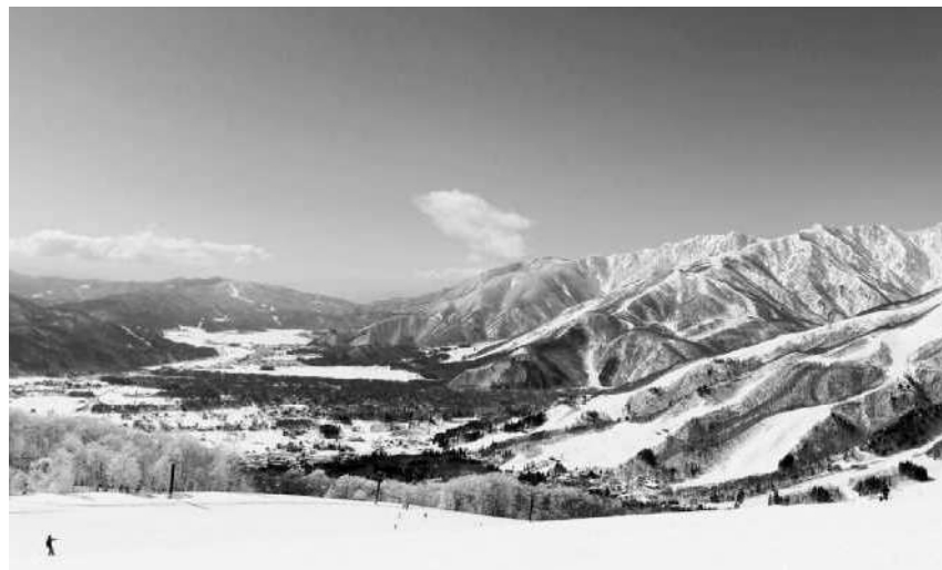
●JR東日本・白馬駅前のバス停留所●白馬村のスキー場