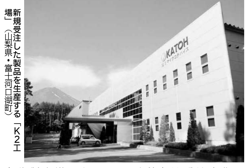
新規受注した製品を生産する「K2工場」(山梨県・富士河口湖町)

【甲府】加藤電器製DCCにともな、今回が初めてとなる。加藤電器製DCCにともな、今回が初めてとなる。加藤電器製DCCにともな、今回が初めてとなる。