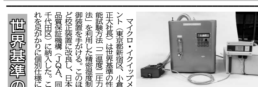
マイクロ・イクイップメント、JQAに納入

【横浜】神奈川県で神奈川県知事賞(副賞)として、25日に横浜西区(賞100万円)などを選定する。最終審査に10社進出。神奈川県で神奈川県知事賞(副賞)として、25日に横浜西区(賞100万円)などを選定する。